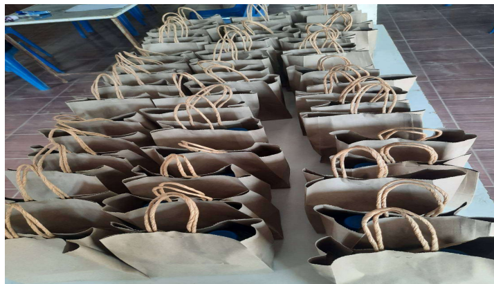
ประชุมประชาคมแผนพัฒนาท้องถิ่น พ.ศ.2571-2575 บ้านปละ หมู่ 4 ณ.ศาลาประชาคม เวลา 12.00-16.30 น.