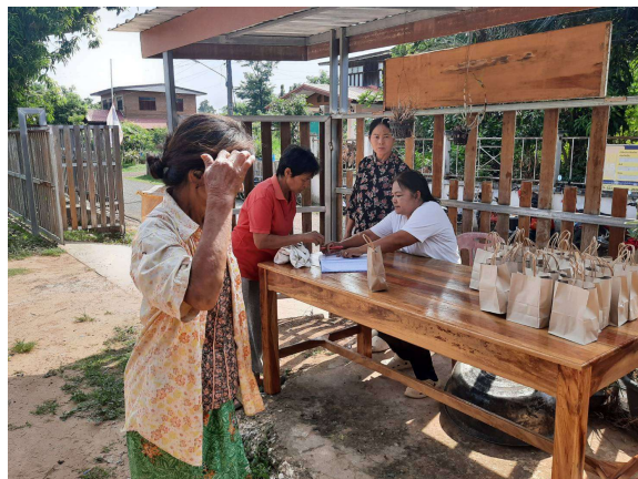
ประชุมประชาคมแผนพัฒนาท้องถิ่น พ.ศ.2571-2575 บ้านศรีสว่างพัฒนา หมู่ 14 ณ.ศาลาประชาคม เวลา 13.30 น.-16.30 น. วันที่ 24 เมษายน 2569