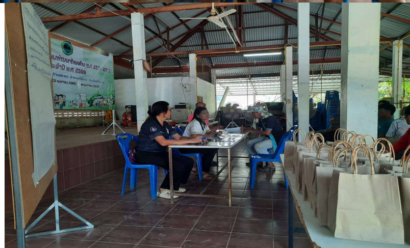
ประชุมประชาคมแผนพัฒนาท้องถิ่น พ.ศ.2571-2575 บ้านโนนทอง หมู่ที่ 9 ณ.ศาลาประชาคม เวลา 13.30-16.00 น